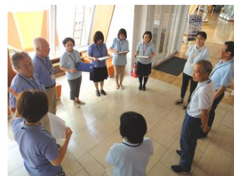
朝礼利用の接客研修

財団職員の能力開発・スキルアップ等を目的に「個人情報保護」、「接客対応」、「コンプライアンス」、「スキルアップ」や「防災・緊急時対応」等の研修会等を実施するとともに、横浜市や他団体が主催する研修会等に職員を派遣しました。