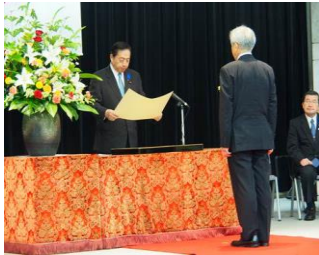
国土交通大臣表彰式

年間 290 日に対し、船内を年間 292 日一般公開しました。日本丸乗船経験のあるガイドボランティアによる船内ガイドを公開日に毎日実施し、お客様に大変ご好評頂きました。ガイドボランティアの登録人数は 2 名増加しました（全 45 名）。27 年度も同様に、お客様のご意見を反映させることにより、サービスの向上に努めました。また、当初予定した回数の総帆展帆（12 回）