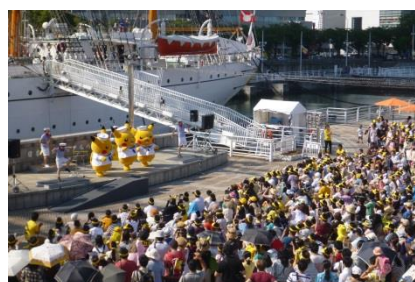
夏のピカチュウイベント

また、正月には、日本丸進水86周年を参加者と一緒に祝うモチつき大会を実施するなど、年間を通じてパークの有効活用を進め賑わい創出を図りました。