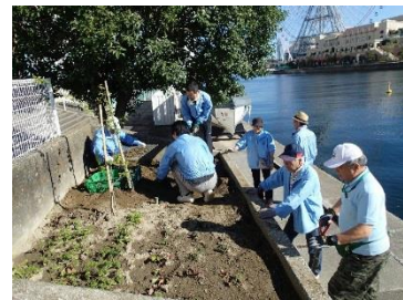
グリーンボランティアの活動

市民との協働による緑地の管理と魅力アップをめざし、西区役所や連合自治会のご協力のもと、グリーンボランティア活動がスタートしました。花壇やバタフライガーデン、芝生の手入れ等に活躍いただいています。