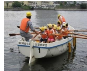
海洋教室での カッター訓練

帆船日本丸及び訓練センターを活用して、青少年錬成のための海洋教室を日帰りコース 8 回、宿泊コース 15 回実施し、参加者 1,228 名となりました。宿泊コースでは、実施学校と事前に訓練プログラムを調整し、希望に沿ったプログラムで実施しました。