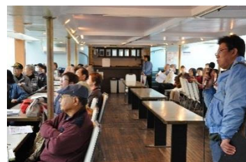
<海辺の観光展> なるほど横浜海の観光散歩