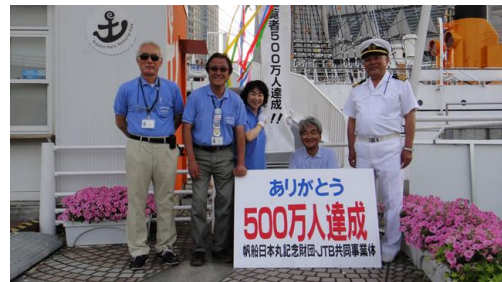
5 月 30 日に 500 万人達成

また、海事思想の普及活動の一環として、日本丸を活用した市民参加型の事業展開を図り、市民の皆様に日本丸の事業活動をより理解していただけるよう努めました。