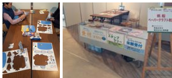
旅いく 2015 キッズフェスタ in 国営昭和記念公園

ウ J T B グループを始めとして、旅行会社へのインセンティブの展開を図りました。