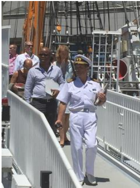
加盟各国の方が視察

平成27年7月に国際海事機関（IMO）の加盟各国による「世界海の日パラレルイベント」が日本で開催され、海洋立国日本を世界に発信するイベントとして、「海事教育及び訓練」をテーマにセミナー・パネルディスカッション・視察等が展開され、そのイベントに協力しました。