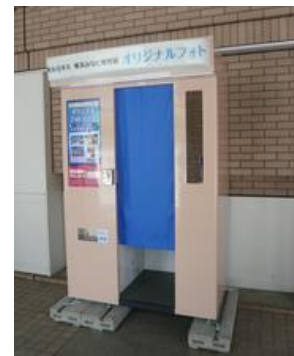
来場記念撮影フォトブース

来場記念撮影フォトブースを南回廊に設置し、来場者様向け新たな思い出づくりサービスを行いました。