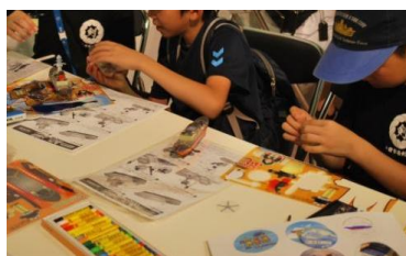
<博物館大集合> ペーパーモデル