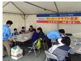
横浜マリノスのイベントに参加

エ 横浜マリノスと連携し、オリジナル帆船ペーパークラフトの作成やホームゲームイベントへの出店などを実施するとともに、横浜マリノスの広報媒体による情報発信を行いました。