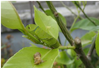
ナミアゲハの最終齢幼虫

年間を通じて季節に適した草花を配したほか、ゴーヤ、ウマノスズクサ、パッションフルーツ等からなるグリーンカーテンを職員の手で設置・育成し、夏の涼を演出しました。また「バタフライガーデン」や「バッタの原っぱ」の整備、ドック内でのアマモの育成など生き物にやさしい取組を行いました。