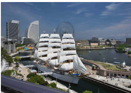
良好な保存を目指し万全な整備