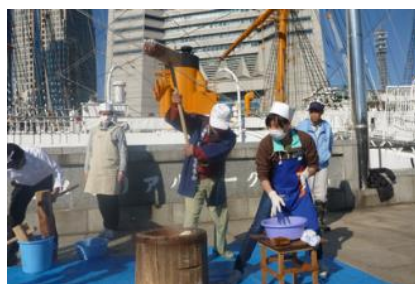
正月モチつき大会