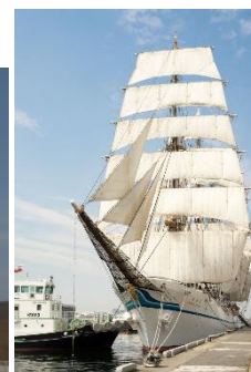
新旧帆船日本丸同時総帆展帆 (右が新日本丸)