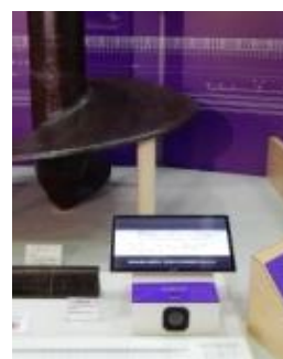
動画「大さん橋の作り方」 の映像を設置

27年度は新たな展示として、「大さん橋の建設」に、大さん橋で使用されたスクリーパイル（鉄螺旋杭）のねじ込み方法を解説した動画「大さん橋の作り方」の映像を設置して、来館者の理解の一助としました。また、完成した南本牧ふ頭MC-3コンテナターミナルなど展示情報の更新を適宜実施しました。