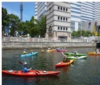
シーカヤック教室

平成27年度のシーカヤック教室は、延べ85回開催し、1,430名(有料人数ベース)の方に御参加いただきました。また、平成27年度の『第4回日本丸杯カヌーポロ』大会は2日間の実施とし、より多くの方々に参加いただき、インナーハーバーの賑わい創出に貢献しました。