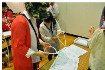
<海洋教育展> キッズが教えるロープワーク教室

また、秋に横浜周辺を中心に観光資源としての海辺の変遷を紹介した企画展「愛すべき海辺の観光の今・昔」を開催しました。関連行事は船に乗り、学芸員の解説で海から横浜の新しい観光エリアのウォーターフロントをめぐる「なるほど横浜 海の観光散歩」を実施しました。