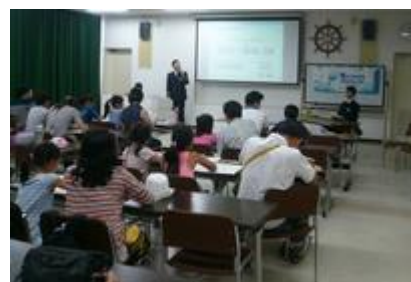
学ぼう！海のしごと